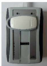
Abb.2: Leseplatzierung des Transponders

Legen Sie den Transponder auf den RFID Lesebereich der secuENTRY pro 7073 ENROLMENT Einheit.