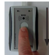
Abb. 5: Zugrichtung des Fingers beim Anlernen

Die Software gibt Ihnen die weiteren Anweisungen vor. Um Ihren Fingerscan in das System einzulesen, ziehen Sie bitte Ihren Finger in Pfeilrichtung über den Sensor.